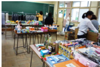
選びやすいようにレイアウト

文化祭バザーでは皆様から御提供いただいた余剰品も販売しています。これまでは普通教棟の階段の下スペースで販売していましたが、今年から教室を割り当ててもらい、販売することができました。余裕を持って商品を陳列することもでき、明るい場所ですっきりと品物を選んでいただくことができたので好評でした。PTA総会の時に実施した「制服のリユース」の商品も並べておくと、「事前に知らせてもらっていたらサイズを確認して来たのに・・・」というお声も頂戴し、まだまだ需要があることを確信する機会となりました。次の機会には大々的に宣伝しておきたいと思います。お寄せいただいた品々の中には余剰品だけではなく、手作りのかわいらしいアクセサリもあり、趣味の物なども、もし御提供いただけるならオークションなどもできるかも！と、いろいろアイデアが浮かんできました。この場をお借りして多くの皆様から品物を御提供いただきましたことを感謝申し上げます。