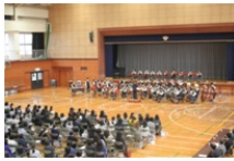
恒例のミニ・コンサート

総会で承認いただきましたPTA行事を充実させていきたいと考えております。どうぞお気軽に御参加ください。各行事の御案内はお子様を通じて書面でお知らせしますが、ホームページでも随時、お知らせさせていただきます。そちらの方もちょくちょく覗いていただけましたら幸いです。