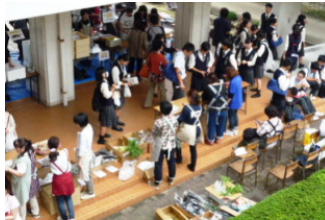
当日券も売れてます！ 野菜もどう？

文化祭バザーでは皆様から御提供いただいた余剰品も販売しています。これまでは普通教棟の階段の下スペースで販売していましたが、今年から教室を割り当ててもらい、販売することができました。余裕を持って商品を陳列することもでき、明るい場所ですっきりと品物を選んでいただくことができたので好評でした。PTA総会の時に実施した「制服のリユース」の商品も並べておくと、「事前に知らせてもらっていたらサイズを確認して来たのに・・・」というお声も頂戴し、まだまだ需要があることを確信する機会となりました。次の機会には大々的に宣伝しておきたいと思います。お寄せいただいた品々の中には余剰品だけではなく、手作りのかわいらしいアクセサリもあり、趣味の物なども、もし御提供いただけるならオークションなどもできるかも！と、いろいろアイデアが浮かんできました。この場をお借りして多くの皆様から品物を御提供いただきましたことを感謝申し上げます。