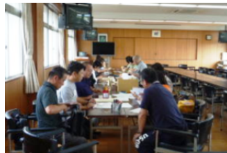
数を決める真剣な話し合い

9月12日（土）13時からPTAの理事さん達にお集まりいただき、来たる文化祭のPTAバザーの準備会を行いました。お忙しいところ、30名近い理事さん達に集まって、作業をしていただいたお蔭でさばきと仕事が片付きました。この日の作業はとっても大事で、注文された前売り券の数をみて、当日券の枚数を決めたり、材料の注文数を読んでいます。この日の作業が当日の成否を決めると言っても過言ではありません。二人一組になって、生徒たちが注文したバザー券のお金があっているか集計し、それからバザー券を分けてもらいました。今年の新商品「から揚げ」の売れ行きが好評で、企画してくださった方々は安堵されました。後は当日、頑張るのみです。