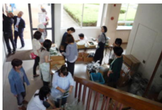
前日の準備に集まって下さった方

9月25日（金）に今年も恒例のPTAバザーを実施しました。ところどころリニューアルしましたが、大きな目玉は「うどん」と「から揚げ」です。昨年は消費税増税にも負けずに頑張りましたが、今年は泣く泣く値上げに踏み切り、その代わりと言っては何ですが、お揚げさんと天かすをプラスしてちょっとゴージャスになりました。それと、新メニューのから揚げを追加したところ、好評を博しました。メニュー一つを変えるにも、いろいろな段取りがあつてのことです。担当の文化広報委員会の方々には昨年度から仕入業者等を調査していただき、また、委員会・役員会で慎重に審議したうえで変更に至っています。ですから、当日、皆様に購入していただき、「おいしかった！」と言っていただいていたほっとしていました。