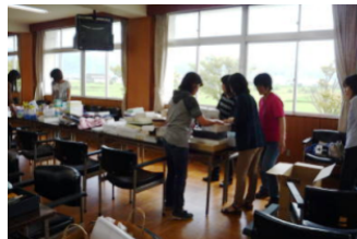
「これ、いくらがいいかなあ」

食品バザーの準備と並行して、皆様方からお寄せいただいた余剰品の値段を付ける作業もしました。タオル、洗剤等の定番商品から、今年は充実している靴（サンダル・スポーツシューズ）まで、お寄せいただいた商品は多岐にわたっており、バラエティに富んでいます。お値打ち品も多いので、どうぞ文化祭当日は足をお運びください。今年は 普通教棟1階 、 107HR教室 で販売しております。PTA総会で好評でした「制服のリユース」も出品します。