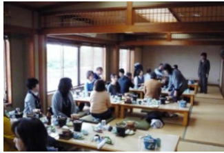
お楽しみの「たご会席」

行き帰りのバスの中ではPTAの人權・同和教育委員会の皆さんによる綿密な準備のお蔭で楽しく過ごすことが出来ました。最初に行った「自己紹介」ならぬ「他己紹介」では、隣り合った座席の人をインタビューして、互いに紹介するというものでしたが、どの方もユーモアを交えながら相手を紹介し、短い時間で、その人となりを理解するよい手立てとなりました。