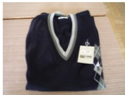
セーター・ベストは品薄です。