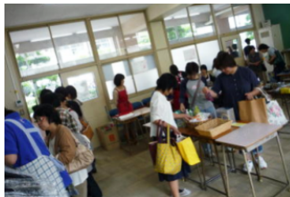
これいいわねえ。こっちも・・・