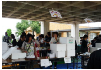
準備万端で余裕の笑顔