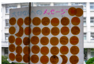
大切な人へのメッセージ 2年生