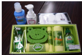
こんなかわいい洗剤のセット！