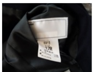
サイズは内ポケットで確認

「制服のリユース」は卒業生の御厚意があり、お世話役の努力の上に成り立っています。この場を借りてお礼を申し上げます。