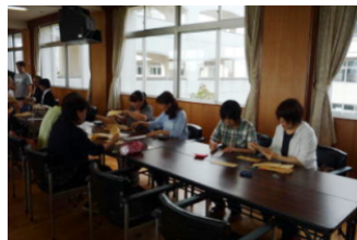
「うどん2枚、から揚げ2枚」

食品バザーの準備と並行して、皆様方からお寄せいただいた余剰品の値段を付ける作業もしました。タオル、洗剤等の定番商品から、今年は充実している靴（サンダル・スポーツシューズ）まで、お寄せいただいた商品は多岐にわたっており、バラエティに富んでいます。お値打ち品も多いので、どうぞ文化祭当日は足をお運びください。今年は 普通教棟1階 、 107HR教室 で販売しております。PTA総会で好評でした「制服のリユース」も出品します。