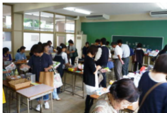
保護者に交じって生徒も物色中

また、例年実施しております保護者の皆様からお寄せいただいた子供へのメッセージと、子供の方から親に向けてのメッセージは人権・同和教育委員により、美しく展示されました。互いに思い合う言葉が綴られていて心温まる内容でした。年齢を重ねる毎に大事なことは言いにくなるものですが、こんな風に素直に気持ちを表せるといいですね。