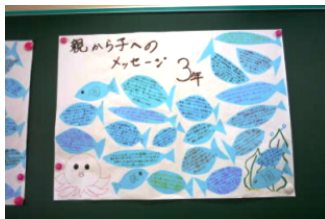
親から子へのメッセージ 3年生

また、例年実施しております保護者の皆様からお寄せいただいた子供へのメッセージと、子供の方から親に向けてのメッセージは人権・同和教育委員により、美しく展示されました。互いに思い合う言葉が綴られていて心温まる内容でした。年齢を重ねる毎に大事なことは言いにくなるものですが、こんな風に素直に気持ちを表せるといいですね。