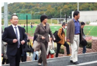
川崎医療福祉大学に着きました。