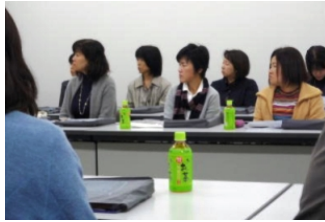
真剣に耳を傾ける保護者の皆さん