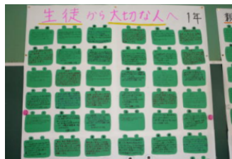
生徒から大切な人へ・・・ 1年生

文化祭では生徒が活躍するだけでなく、PTAの皆様も大活躍していただきました。さて、次のPTA行事は 研修旅行 です。今年は 岡山 に行きます！ 11月14日土曜日 です！ 近日連絡予定