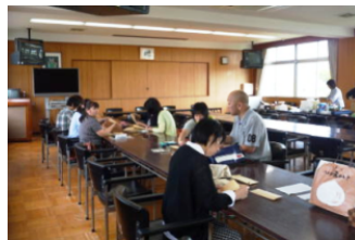
間違えないように・・・